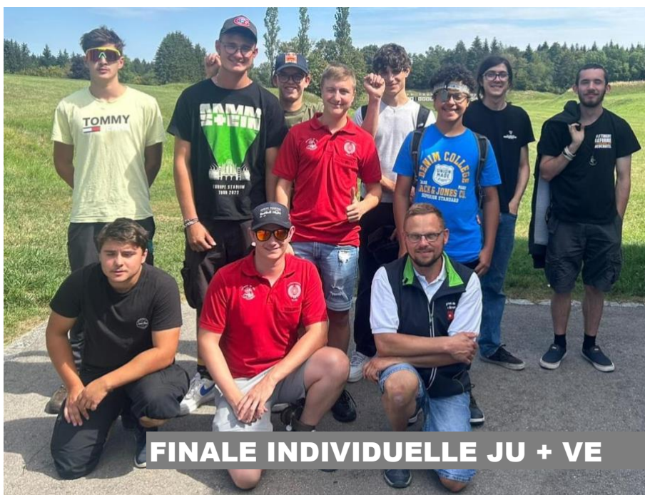
FINALE INDIVIDUELLE JU + VE

Lors de la finale cantonale, tirée le 19 août 2023 à Romont, 26 groupes ont participé. Les formations jeunes tireurs broyades sont restées cantonnées en seconde moitié du classement. Murist/La Molière y a décroché le 16 ème rang, avec 622 pts et le groupe de Aumont s'est classé au 22 ème rang avec 590 pts. Le groupe de St-Aubin n'a pas participé par manque de tireurs.